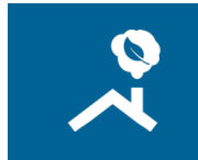
Energie & Umwelt