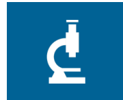
Forschung & Entwicklung