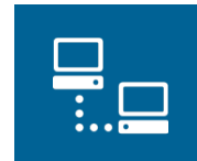
IT- & Software- Lösungen