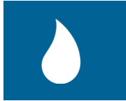
Antriebs- & Fluidtechnik